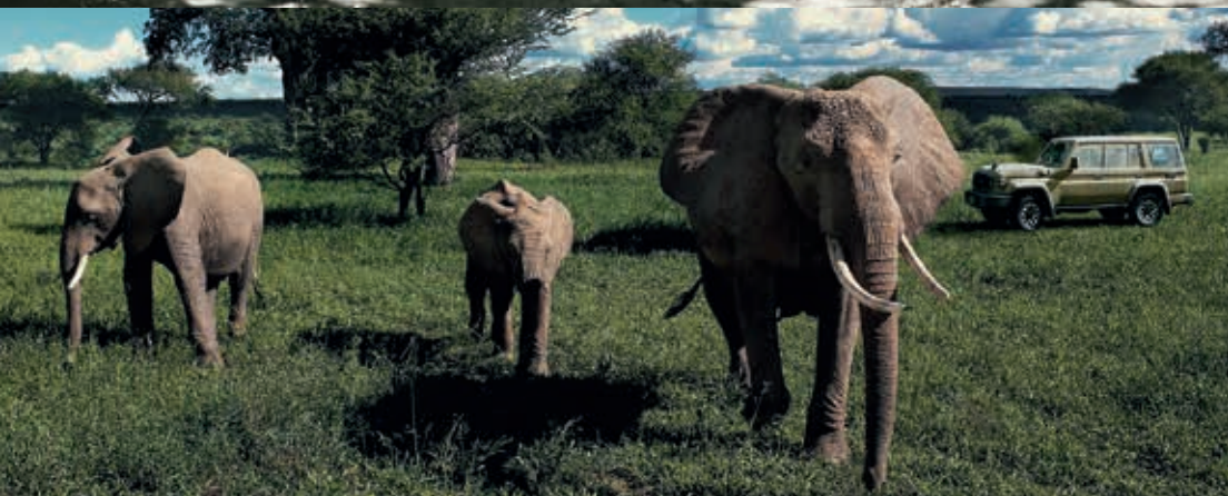
Photo : AX. ボディカラーはページュ<4E9>. 写真は合成です。「後席もシートベルト。チャイルドシートも忘れずに。」ランドクルーザーはすべてのトヨタのお店で。toyota.jp 365日お車選び、装備の使い方、メンテナンス、最寄の販売店、その他カーライフに関することなどお気軽にご相談ください。 トヨタ自動車(株)お客様相談センター ☎0800-700-7700 9時～17時

※フォーム/チャット/手話通訳 のお問い合わせサービスも ご利用いただけます。詳しくは WEBページからご覧ください。